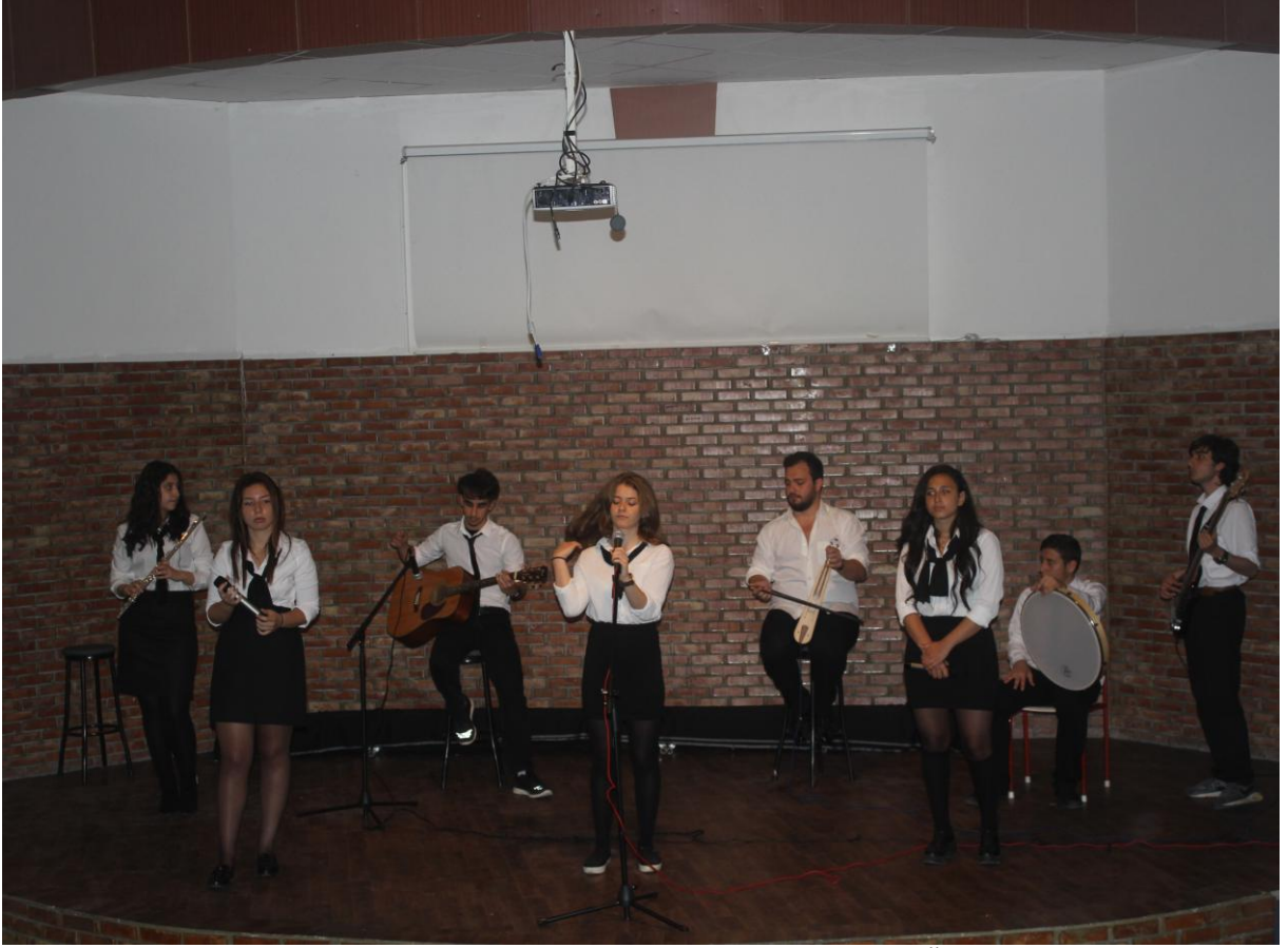
18 MAYIS 2016 GENÇLİK HAFTASI ETKİNLİKLERİ KAPSAMINDA BİLİM ŞENLİĞİ YAPILDI